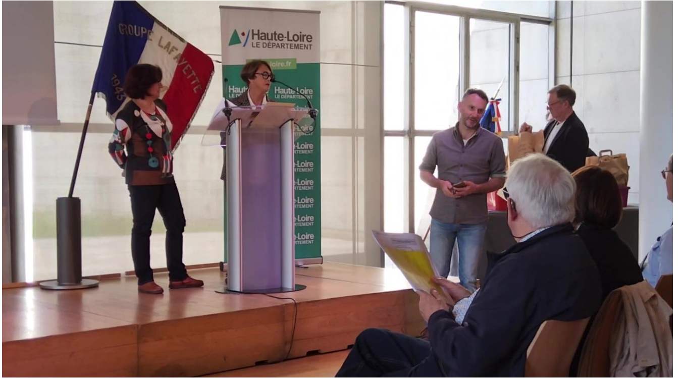
Le public de l'espace Jacques Barrot de l'Hôtel du département