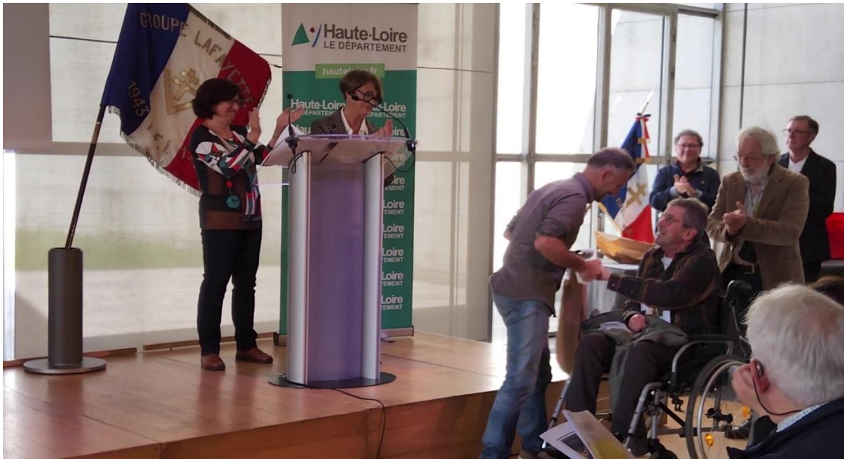
Les élèves étant en voyage linguistique en Irlande le 6 mai 2026, c'est M. Moneyron qui réceptionne les prix pour eux