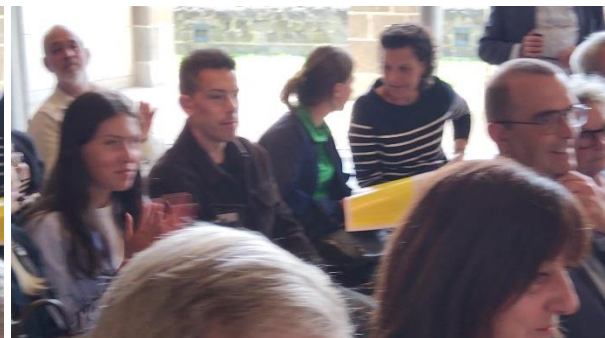
Le jeu coopératif RETOURNA'QUIZ